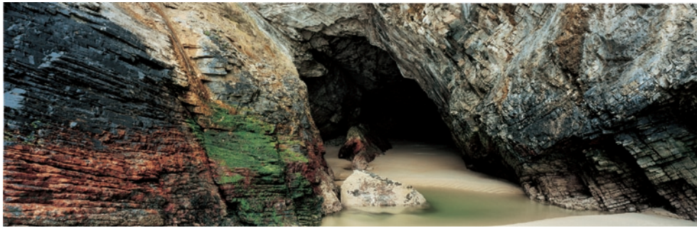
Storm Last Night #20