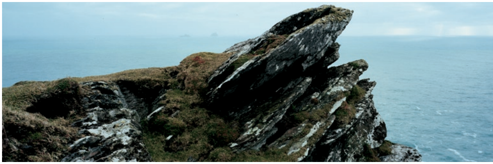
Storm Last Night #1 ©Nao Tsuda / courtesy of hiromiyoshii